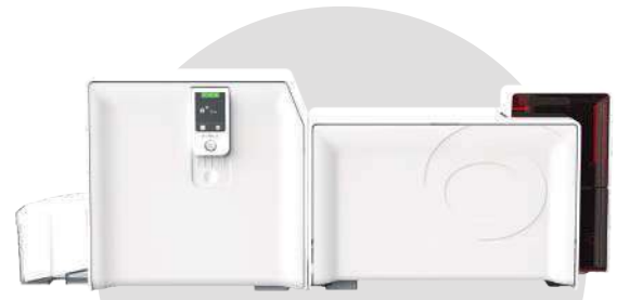
Laminarka CLM w połączeniu z drukarką Primacy