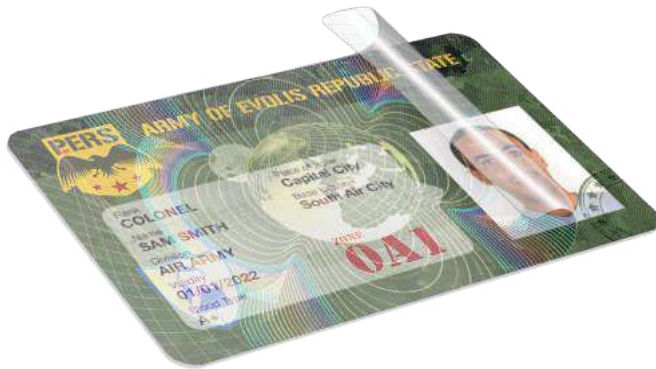
Nanoszenie holograficznego filmu zabezpieczającego